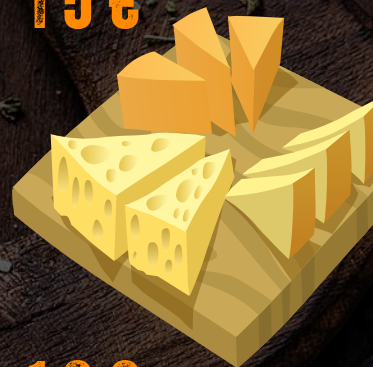
TABLA JAMÓN IBÉRICO Y QUESO